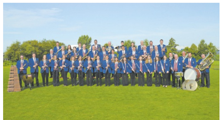
Musikverein Harmonie Nußbach