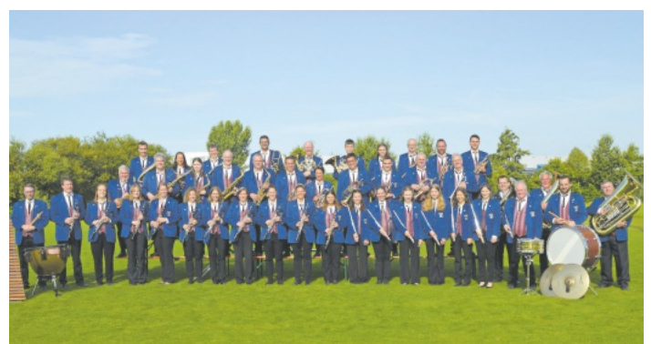
Musikverein Harmonie Nußbach

Am Mittwoch, 17. Juni findet unser Seniorennachmittag statt - wir treffen uns um 14.30 Uhr im alten Rathaus . Also bis dann - euer DRK -Seniorenbetreuungsteam