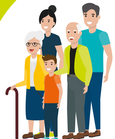
Griff: Gstudio / stock.adobe.com