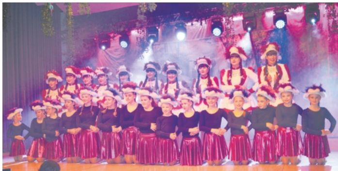
Eröffnen das Programm: Die Litzemer Gardetänzerinnen