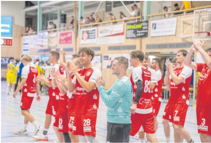
Die Mannschaft bedankt sich bei allen Fans und Sponsoren

HSG Willstätt-Hanauerland 3 - TuS Helmlingen 3