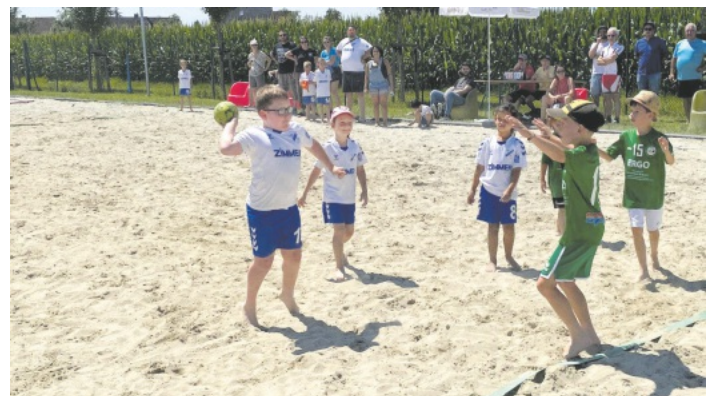
Die Handball-Minis des TV Auenheim zeigten eine ansprechende Leistung.

3:0 Altdorf-Ettenheimer Beach Kids 1 - TV Auenheim Minis