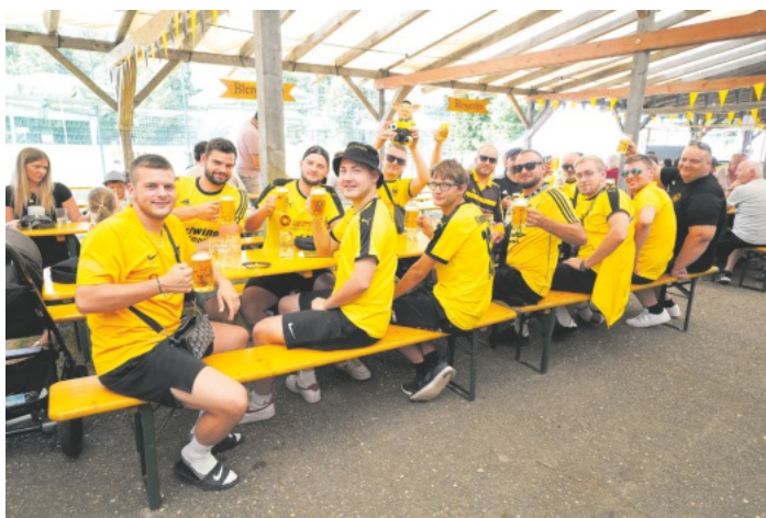
Beste Stimmung bei den Jungs in schwarz und gelb.

Wir freuen uns auf einen tollen Sommer und euren Besuch.