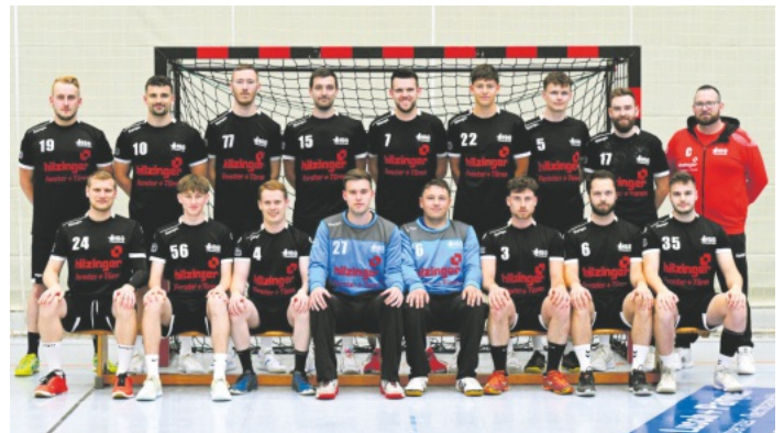
Das Team der Männer 2 in der kommenden Saison.

Die Spielpläne werden auf der Homepage der HSG Hanauerland eingestellt, sobald diese vom Verband freigegeben werden.