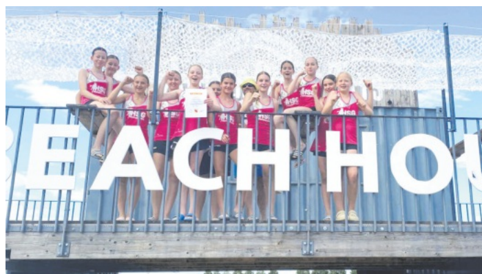
Der 2. Platz bei den Südbadischen Meisterschaften wurde gefeiert.