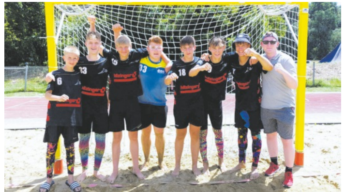
Die männliche B-Jugend der HSG Hanauerland schaffte es in Fridingen bis ins Finale.

Trainer und mitgereiste Fans zeigten sich mit dem zweiten Platz zufrieden. Dennoch konnten die Jungs stolz das Turnier beenden. Es war ein toller und erfolgreicher Tag, auch wenn morgens bei der Abfahrt doch recht müde Krieger an der Hanauerland Halle standen.