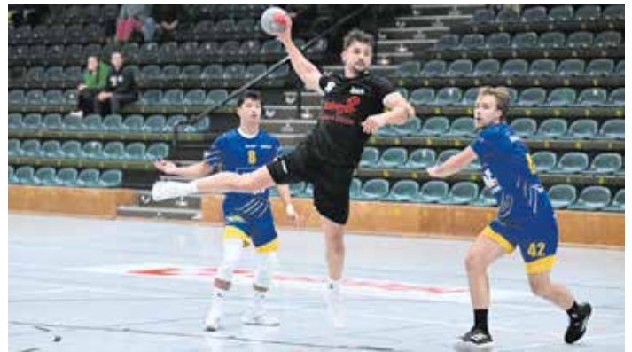
Kann Tim Walter mit der HSG Hanauerland 2 endlich die rote Laterne weitergeben?

10 Punkte haben die Frauen der HSG Hanauerland bisher gesammelt und sind damit im Soll. Der 35:23 (19:11) Heimsieg gegen die HSG Mimmenshausen-Mühlhofen überraschte ein wenig wegen der Deutlichkeit, doch traute man im Vorfeld der Begegnung den Frauen einen weiteren Erfolg zu. Gleiches gilt für das anstehende Spiel. Gegen die HB Kinzigtal konnte das Hinspiel mit 30:22 gewonnen werden. Die Gastgeberinnen gelten zwar als heimstark, doch endeten die letzten beiden Heimspiele unentschieden.