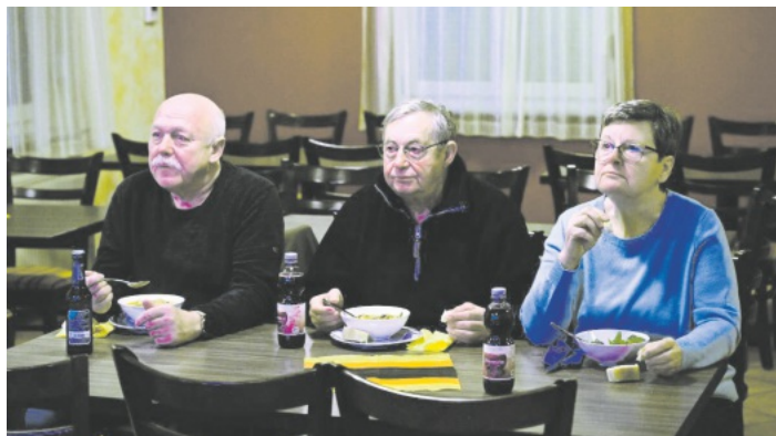
Die besten Plätze waren schon früh belegt. Bohneneintopf, Panini und Feldsalat, dazu noch ein 34:25 (18:13) Sieg gegen Nordmazedonien, was will man mehr.