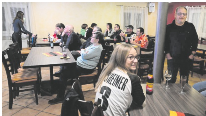
Gemeinsam wurden im „Hisl“ des TV Auenheim die Spiele der Deutschen Handballer angeschaut.

ten Platz belegt. Weitere Spieltermine sind auf der Homepage des TV Auenheim zu finden. Besuchen Sie www.tv-auenheim.de