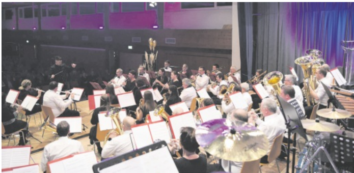
Jubiläumskonzert der „Harmonie“ Leutesheim

Wir möchten uns bei allen Helfern an der Abendkasse und hinter den Theken sowie bei unserem Technik-Team herzlich bedanken! Außerdem vielen Dank an unser Publikum - es war toll!