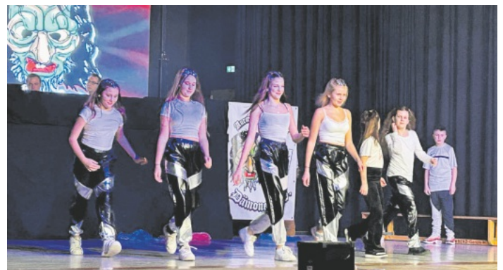
Am vergangenen Samstag trat der TV Auenheim mit den „Dance for Kids III“ bei der Dämonennacht der Auemer Wallgrawe auf.

„Dance for Kids III“ begeistern bei der Dämonennacht Zu Gast bei der 12. Dämonennacht der Auemer Wallgrawe Dämonen waren die „Kids“ des TV Auenheim. Schwungvoll ging es für den Nachwuchs der Abteilung „Dance for Kids“ des TV Auenheim in die aktuelle Fasnacht-Saison. Seit dem Jahr 2000 gibt es die Narrenzunft in Auenheim, seit 2009 gibt es den Zunftabend. Erstmals durften die „Kids for Dance III“ bei der Dämonennacht auftreten und ernteten viel Beifall, wurden sogar zu einer Zugabe aufgefordert. Über Neuzugänge (männlich und weiblich) ab dem Alter der 5. Klasse freut sich die Abteilung „Dance for Kids“ jederzeit. Trainingszeiten und Ansprechpartner sind auf der Homepage des TV Auenheim zu finden. www.tv-auenheim.de