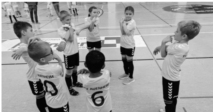
Ohne Aufwärmen geht nix!

Voller Vorfreude ging es am 22.11. für ein paar Schüler der Grundschule nach Willstätt zu Jugend trainiert für Olympia. Begleitet und unterstützt wurden sie dabei von Dominique Waag, die aktiv beim FV Auenheim in der Damenmannschaft spielt. Vielen Dank nochmal dafür. Insgesamt waren 6 Schulen vertreten. Dazu gehörten außer Auenheim noch Offenburg, Goldscheuer, Sand, Willstätt und Leutesheim. Die ersten 3 Mannschaften konnten sich weiter qualifizieren. Leider war die Grundschule Auenheim nicht mit dabei. Aber auch hier zählt der Olympische Gedanke: „Dabei sein ist alles!“ Und der Spass steht hier ja auch an erster Stelle.