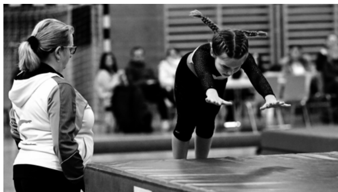
Die D2 hatte in der Turnhalle Auenheim ihren letzten Wettkampf der Vorrunde zu absolvieren.

Die 1. Mannschaft des TV Auenheim gewann mit 156,70 zu 155,15 beim TV Oberachern, und beendet die Vorrunde ebenfalls auf dem 2. Tabellenplatz. Das Reserve-Team blieb weiter sieglos, zeigte aber gute Ansätze.