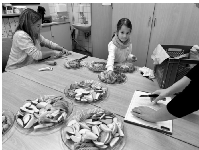
Einfach lecker!

Bis zu dreimal im Monat wird die Grundschule Auenheim von der Gärtnerei Schneider aus Urloffen mit Obst und Gemüse beliefert. Durch das EU-Schulprogramm erhalten Kinder in Grundschulen und Kitas regelmäßig Obst & Gemüse und/oder Milch(-produkte) von regionalen Lieferantinnen und Lieferanten. Kinder kommen damit auf den Geschmack dieser Lebensmittel und lernen bereits in jungen Jahren ganz nebenbei, sie in ihren Essalltag zu integrieren. Bei uns in der Grundschule Auenheim wird das Obst und Gemüse immer am Freitag früh um 8.00 Uhr von drei „Obstmüttern“ zurechtgeschnippelt und für alle 4 Klassen gerecht aufgeteilt. Der Aufwand ist gering und dauert max. 30 Minuten. Darum sind wir auch immer auf Unterstützung der Eltern angewiesen. Gerne erweitern wir den Begriff Obstmütter auch auf Obstpapas oder -omas. Leider lässt sich die Reaktion der Kinder, wenn wir mit den gefüllten Tellern in die Klassen kommen, nicht auf einem Bild festhalten. Strahlende Kinderaugen, viele „Ooooh's“ und „Juhuuu's“ und am Ende leergeputzte Teller zeigen, dass sich der kleine Aufwand lohnt!