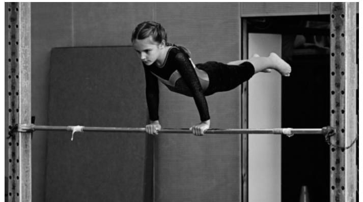
Konzentriert wurden die Übungen vorgetragen.

Weitere Informationen und eine Bildergalerie zu diesem Wettkampf gibt es auf unserer Homepage www.tv-auenheim.de .