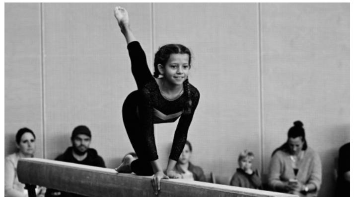
Balance war auf dem Schwebebalken gefordert.