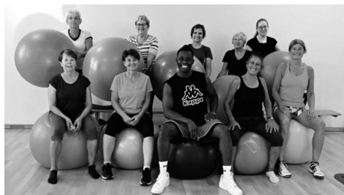
Die Rückenfit-Truppe beim TV Auenheim nach einer schweiß-treibenden Einheit.

Genauere Informationen zu den einzelnen Angeboten sind auf unserer Homepage unter www.tv-auenheim.de zu finden.