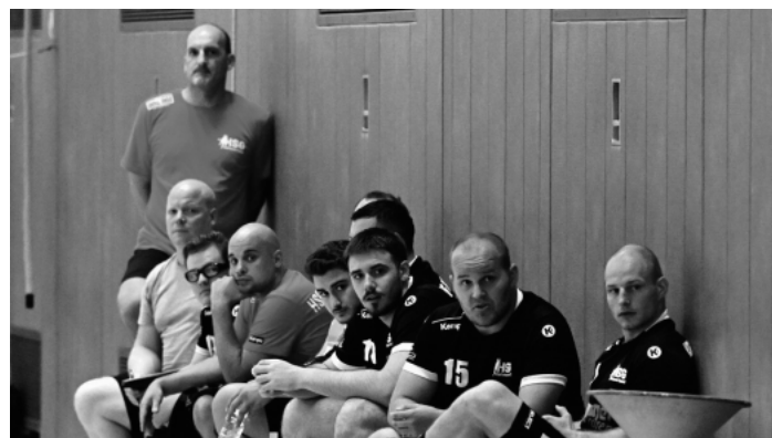
Die Bank der HSG Hanauerland ist gut besetzt.

14:15 Uhr, TV Friesenheim - HSG Hanauerland 2 (mJC-BK-2)