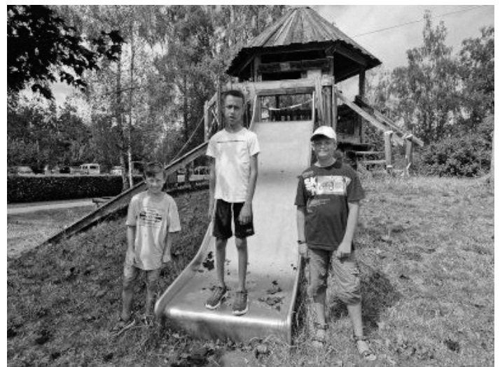
Die Schüler der inklusiven Klassen freuen sich auf neue Spielgeräte.

Für die Reparatur und Anschaffung von Spielgeräten ist der Oberlin-Schulverbund auf Spenden angewiesen. Helfen Sie mit. (Spendenkonto: IBAN: DE89 5206 0410 0200 5061 33, Stichwort: Spielgeräte)