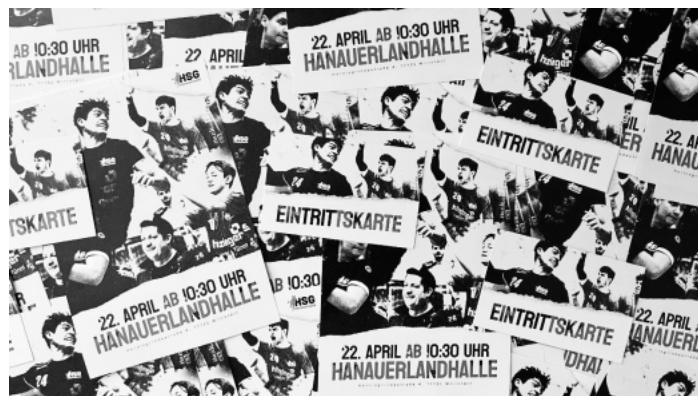
Die HSG Hanauerland feiert sich selbst. Nach der erfolgreichsten Saison der HSG Hanauerland seit der Gründung, wird am Samstag 22.04. gefeiert.

Anschließend Party mit Barbetrieb und Unterhaltung. Besuchen Sie unsere Homepage www.hsg-hanauerland.de