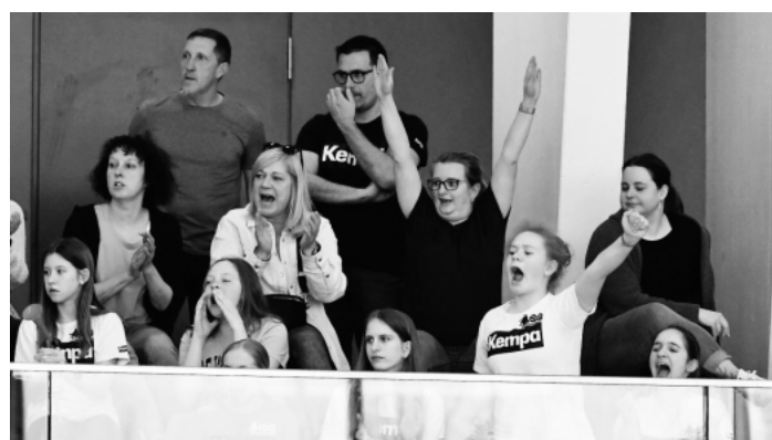
Wir bedanken uns bei unseren Fans für die stetige Unterstützung bei unseren Spielen. Ihr seid die Besten!