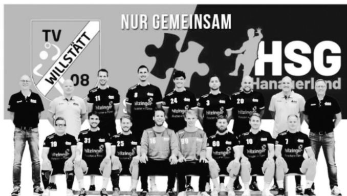
Die Männer der HSG Hanauerland sicherten sich frühzeitig die Meisterschaft.

Besuchen Sie unsere Homepage: www.hsg-hanauerland.de