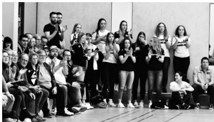
Standing Ovationen der Frauenmannschaft für die Männer der HSG Hanauerland.