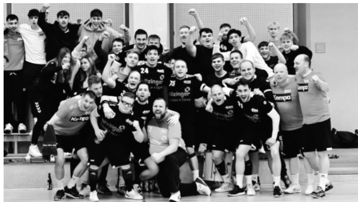
Großer Jubel nach dem 34:25 Erfolg im Topspiel der HSG Hanauerland gegen die SG Freudenstadt/Baiersbronn.