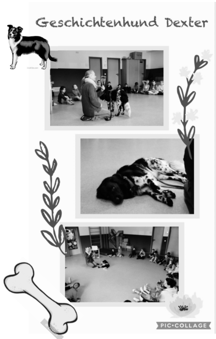
Der Lesehund Dexter war zu Besuch

Wir hatten einen lustigen und informativen Vormittag und freuen uns darauf, wenn Dexter mal wieder zu uns in die Kita kommt. An dieser Stelle ein großes Dankeschön an Frau Boseman und Dexter für dieses schöne Angebot.